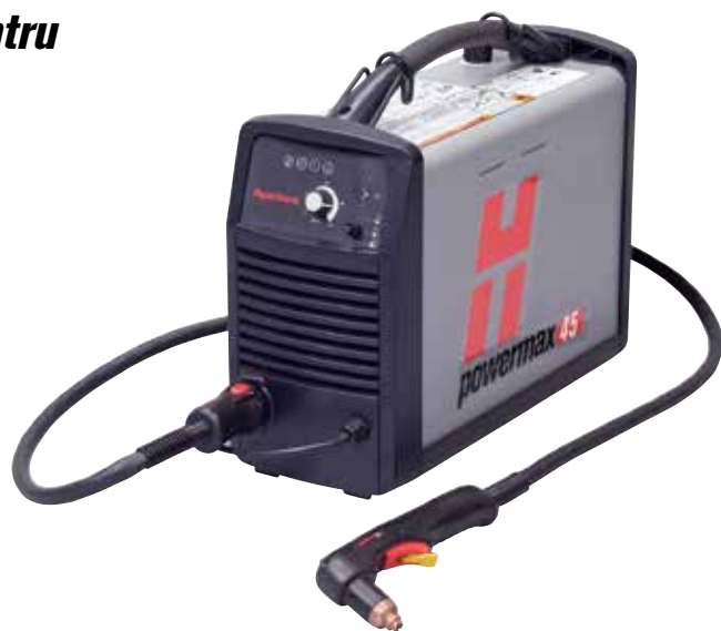
Pistolet manual T45v