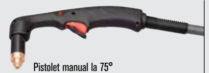
Pistol manual la 75°

(pentru mai multe tipuri de pistolete, consultați www.hypertherm.com )