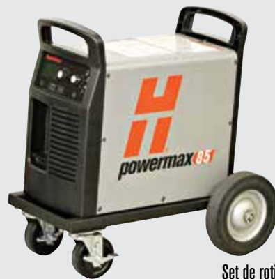
Set de roți