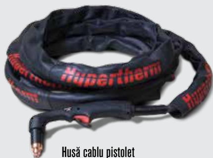
Husă cablu pistol