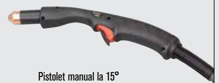
Pistol manual la 15°